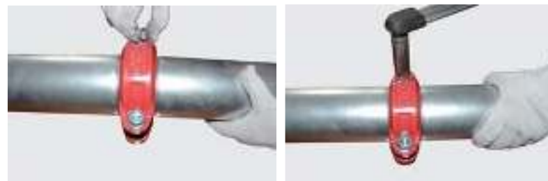
Рис.3. Грувлочное соединение гибкой муфтой.